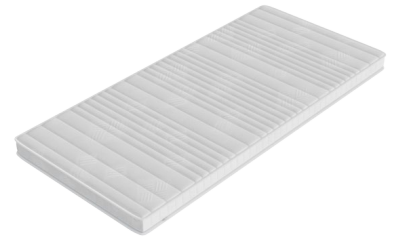
Ausführung mit Border