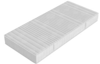
Ausführung mit Border