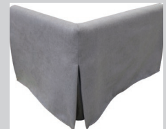
Nr. 2 für Diamo und Nr. 3 für Decato