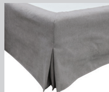
Nr. 1 für Demira und Daretta